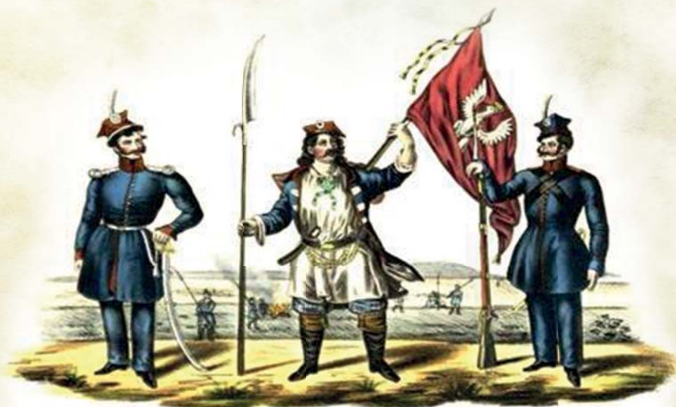
Officer Gwardii Narodowej Officer der Nationalgarde