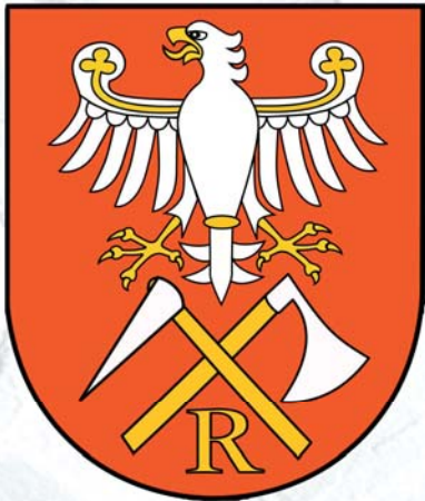
Projekt herbu Gminy Raciąż

Podczas XXII Sesji Rady Gminy Raciąż przyjęta została uchwała opiniująca projekt herbu i flagi Gminy Raciąż. Jest to kolejny etap działań podjętych w sprawie ustanowienia tych dwóch symboli naszej jednostki samorządowej.