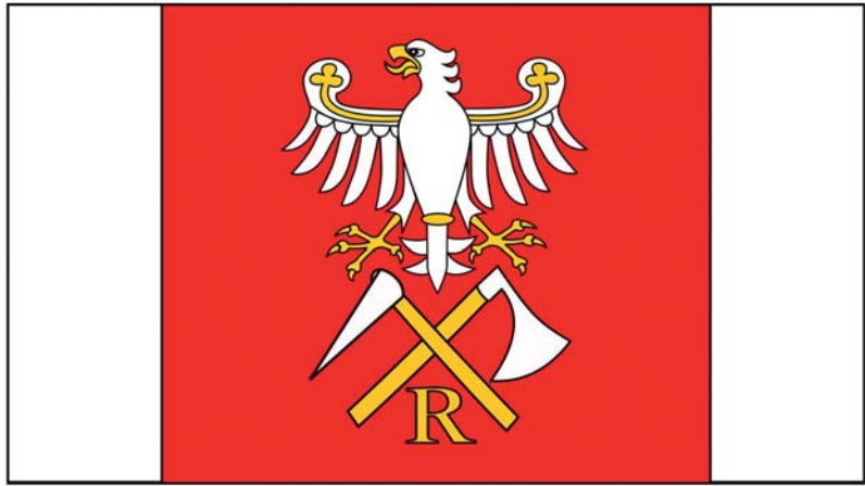
Projekt flagi Gminy Raciąż.