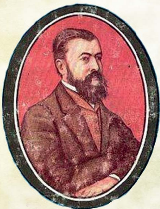
Teofil Łapiński 1827-1886

Replika powstańczej bandery wojennej, znajduje się w Szkole Podstawowej im. Powstańców Styczniowych w Uniecku, jak również na maszcie przy grobie Powstańców Styczniowych na terenie cmentarza parafialnego w Uniecku – z inicjatywy autora niniejszej publikacji.