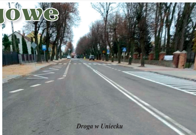
Droga w Uniecku

dofinansowanie z „Programu Rozwoju Obszarów Wiejskich 2014-2020” w ramach „Budowy lub modernizacji dróg lokalnych” w kwocie 551 029,00 zł