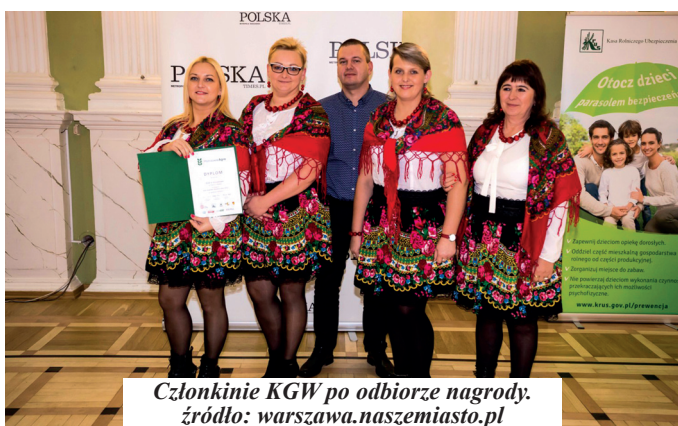
Członkinie KGW po odbiorze nagrody.