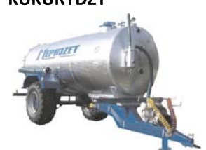
WÓZY ASENIZACYJNE od 2 300 – 10 000 litrów

26 – 300 OPOCZNO UL. WAŁOWA 1 radmasz@onet.eu