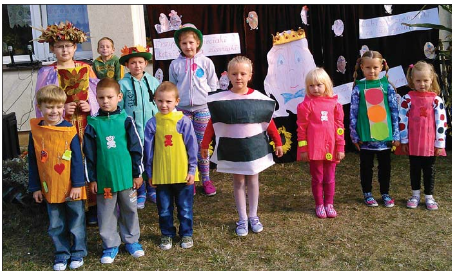
Przedszkolaki podczas ziemniaczanego święta

Tradycją Szkoły Filialnej w Kraszewie Gaczułtach stało się obchodzenie święta pieczonego ziemniaka w ciepłe wrześniowe dni. Jest to także impreza integracyjna dla dzieci, rodziców i nauczycieli z klas I-III, oddziału przedszkolnego i punktów przedszkolnych wchodzących w skład Zespołu Szkół w Koziebrodach. 19 września odbyły się: spotkanie z policjantem, inscenizacja „Bezpiecznej drogi”, przedstawienie teatralne „Kartofelki”, jesienne zgaduj-zgadule, wykonanie angielskiej piosenki o jesieni „Autumn song”, wspólne płyśy i konkurencje sportowe z pyrami w roli głównej. Rada Rodziców Szkoły Filialnej wszystkim uczestnikom zaserwowała ciepłe kieł-