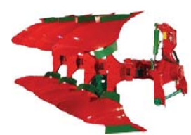
PŁUGI JEDNOBELKOWE ZAGONNE OBRACALNE