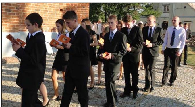
W procesji szli gimnazjaliści przystępujący do sakramentu bierzmowania...