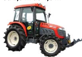
CIĄGNIKI ROLNICZE moc od 30 KM do 150 KM