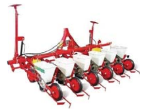
SIEWNIKI DO BURAKÓW KUKURYDZY