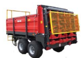
ROZRZUTNIKI OBORNIKA ładowność od 2,5 t do 14 t