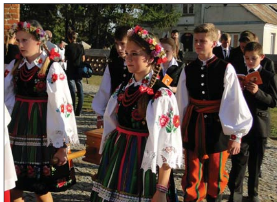
Relikwie niosła młodzież ubrana w stroje łowickie