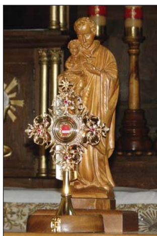
Relikwie św. Stanisława Kostki