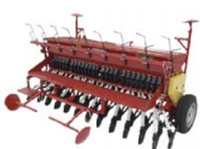
SIEWNIKI 2,5 m – 3,0 m REDLICOWE TALERZOWE