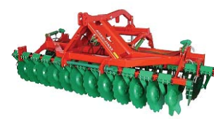
AGREGATY UPRAWOWO-SIEWNE od 2,5 m do 4,0 m