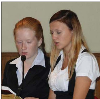
Młodzież aktywnie uczestniczyła w nabożeństwie