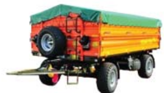
PRZYCZEPY ROLNICZE ładowność od 1,5 t do 12 t