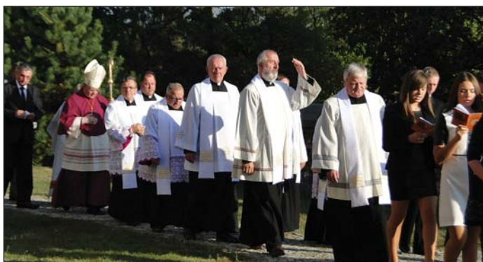
... oraz księża z sąsiednich parafii