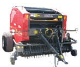
PRASA BELUJĄCA - ROLUJĄCA - ZWIJAJĄCA