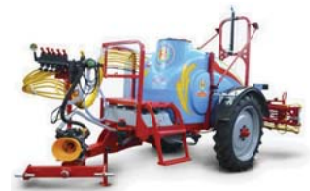
OPRYSKIWACZE od 200 do 2 000 litrów