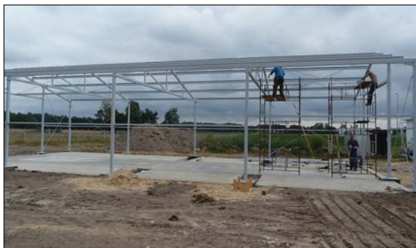
PSZOK w budowie...

Całkowity koszt przedmiotowego zadania wynosi 331 471,83 zł.