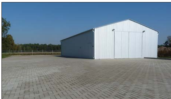
... i ukończony