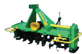
GLEBOGRYZARKI szerokość 1,4 m – 2,1 m