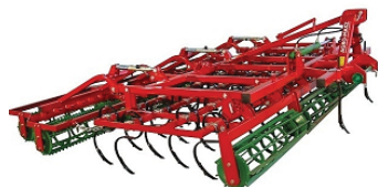
AGREGATY UPRAWOWE od 1,8 m do 5,6 m

radmasz@radmasz.pl radmasz.otomoto.pl www.radmasz.pl