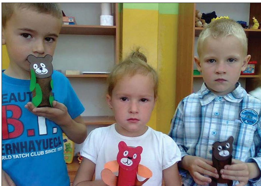
Przedszkolaki i ich misie