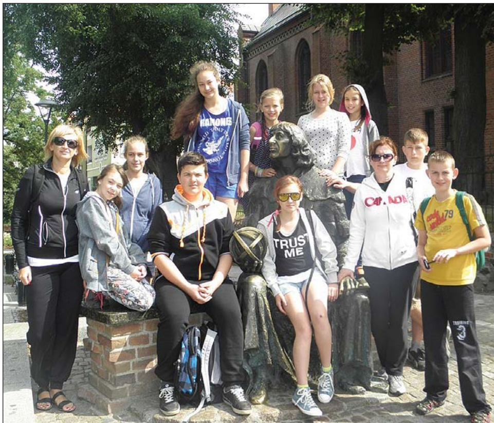
Fotka koziębrodzkiej grupy