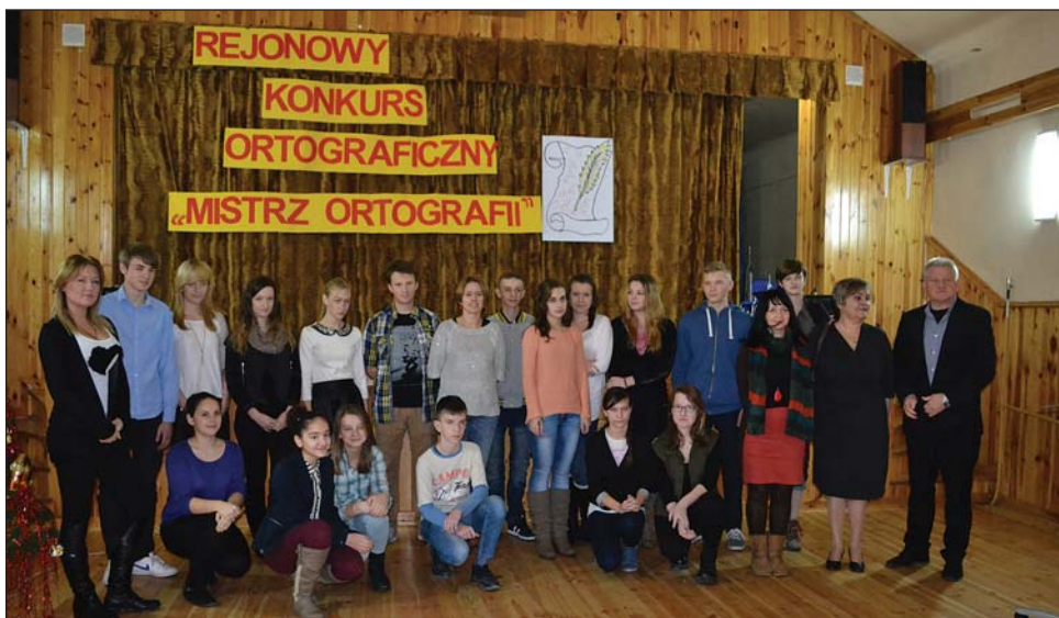
Uczestnicy konkursu ortograficznego i organizatorzy

Po raz kolejny Zespół Szkół Społecznego Towarzystwa Oświatowego w Raciąży we współpracy z Miejskim Centrum Kultury i Sportu zorganizował, 16 grudnia br., Rejonowy Konkurs Ortograficzny „Mistrz ortografii”, dla uczniów szkół gim-