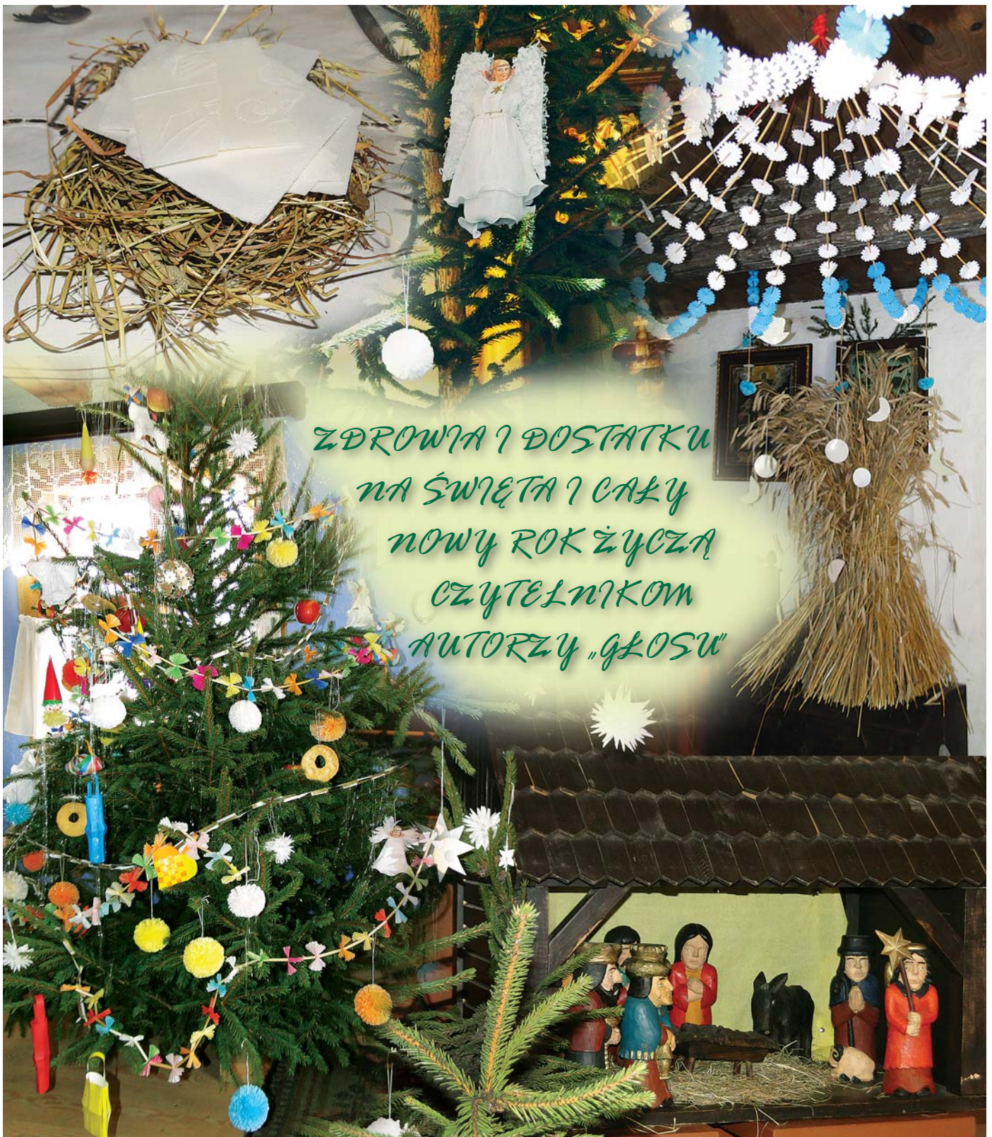
Na zdjęciach fragmenty wystawy bożonarodzeniowej w Muzeum Wsi Mazowieckiej w Sierpcu