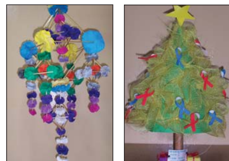
Niektóre prace konkursowe