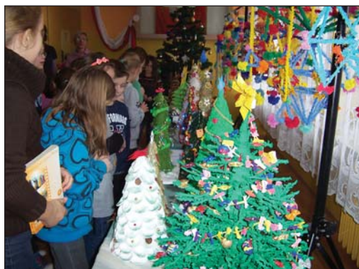
Na szkolnym korytarzu pojawiła się piękna dekoracja

Pająki przybierały najróżniejsze formy i kształty: • pająki krystaliczne – ażurowe graniastopy ze słomek; • pająki kuliste – patyczki wbijane w kuliste warzywa, np. burak albo seler; • żyrandole – przestrzenne formy z grochu, fasoli i słomek • pająki tarczowe – z włóczki i ze słomy w kształcie cztero-, sześci- i ośmiobocznych tarcz.