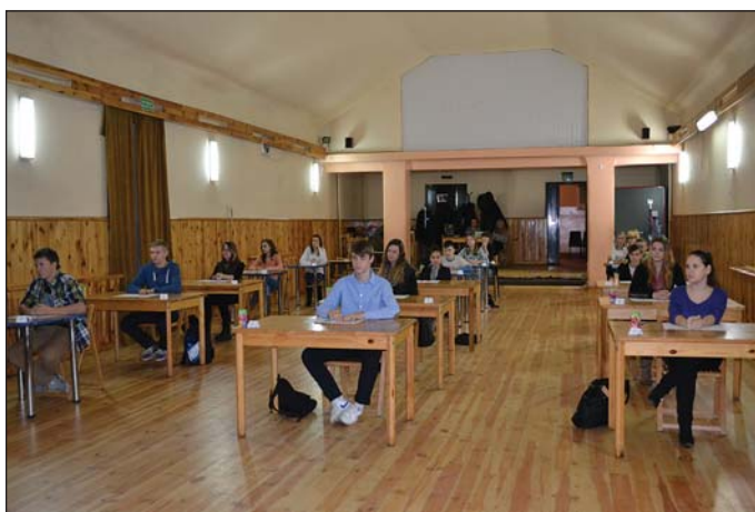
Konkurs odbył się w sali widowiskowej MCKiS w Raciąży