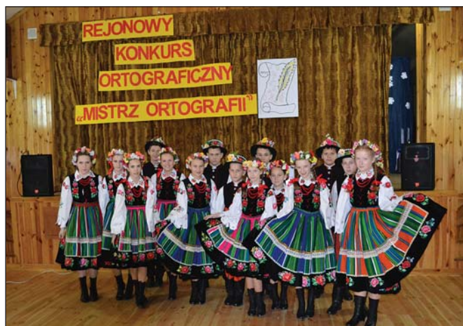
Czas oczekiwania na wyniki umilali Krajkowiaci