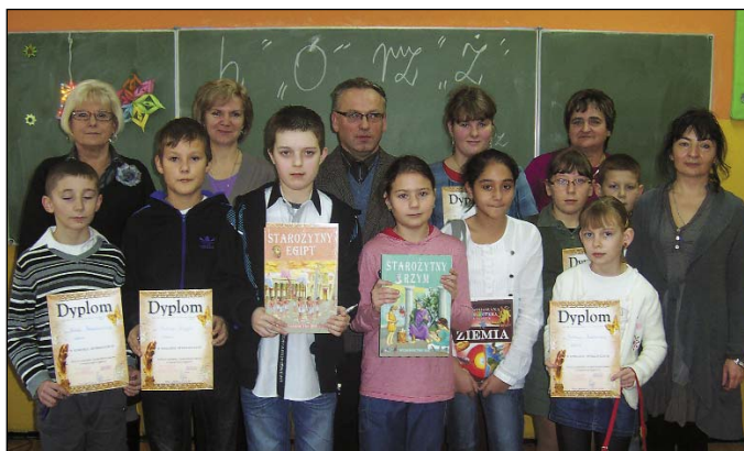
Laureaci i organizatorzy konkursu

Celem konkursu jest przede wszystkim propagowanie wśród uczniów i nauczycieli idei wspólnej odpowiedzialności za język polski. Umożliwia on również uczniom sprawdzenie własnych umiejętności.