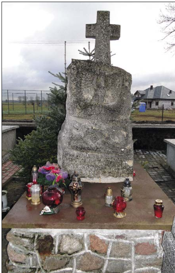
W styczniu 1993 r. na cmentarzu w Uniecku został odsłonięty pomnik „Bohaterom Powstania Styczniowego”

na przodzie ich wskazywał miejsce ukrycia Polaków. Na plebanji skutek wybicia szyb, zgasło światło w latarni, czy też może dno jej źle założone, wypadają więc żołnierze, myśląc, że zdrada. Człowiek mój, przez usunięcie mnie z miejsca, ratuje moje życie od kuli, która wpadłwszy jednym oknem, drugim wypadła i ta w same pierś byłaby mnie razila. Bezwzględnie opuszczam plebanie. Wtedy natychmiast zostaje otoczony przez owych 5 żołnierzy po dopełnionej rewizji, czy nie mam broni i „w plen” na uboczu umieszczony, stoję na dworze w szlafroku z gołą głową i z latarnią w ręku.