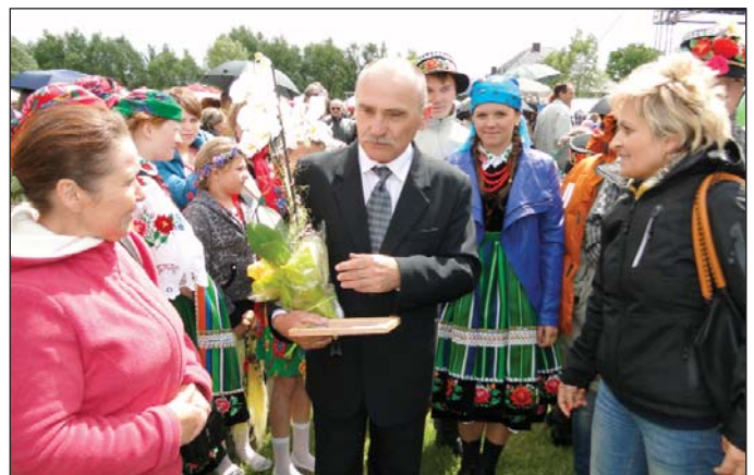
Z życzeniami i kwiatami pospieszyli też Krajkowiczy