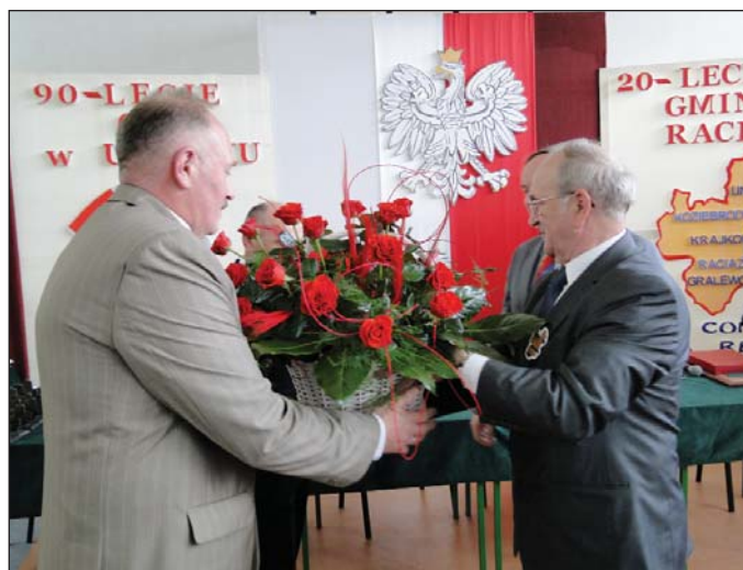
Z koszem czerwonych róż przyjechali przedstawiciele Konwentu Wójtów i Burmistrzów Powiatu Płońskiego