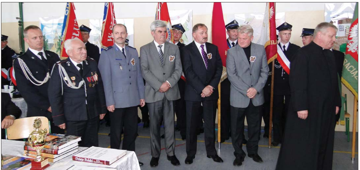
Podczas sesji zasłużonym dla gminy osobom wręczone zostały statuetki gminy Raciąż. Odlana w brązie przedstawia kontury gminy i parafialne miejscowości. Na odwrocie widnieją słowa Macieja Kazimierza Sarbiewskiego: Condit regna labor (Trud buduje królestwa)