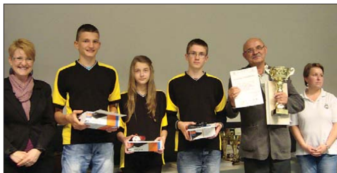
Mistrzowie Mazowsza – reprezentacja Publicznego Gimnazjum w Gralewie

Drużyna Publicznego Gimnazjum w Gralewie wygrała finały rejonowy i wojewódzki i będzie reprezentować Mazowsze na zawodach ogólnopolskich Turnieju Bezpieczeństwa w Ruchu Drogowym. Reprezentacja Szkoły Podstawowej w Gralewie wygrała „rejon”, a na szczeblu wojewódzkim zajęła trzecie miejsce.