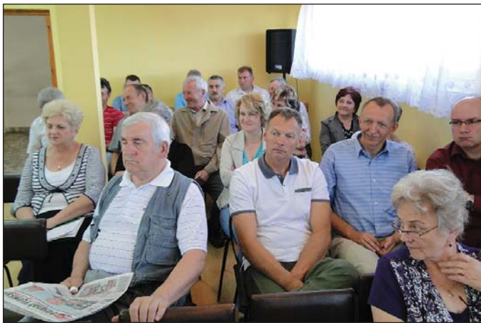
W sesji oprócz sołtysów uczestniczą też dyrektorzy i kierownicy jednostek samorządowych

Są też już odpady, choć zakładu jeszcze nie ma. Jest i smród.