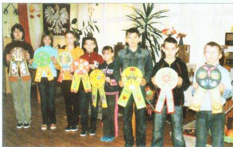
Uczniowie SP Stare Gralewo wyróżnieni I miejscem