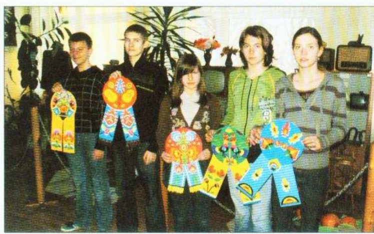
Uczniowie PG Stare Gralewo wyróżnieni I miejscem