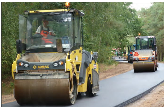
Budowa dróg gminnych