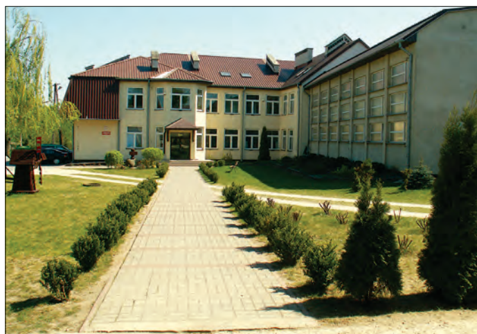
Szkoła w Uniecku