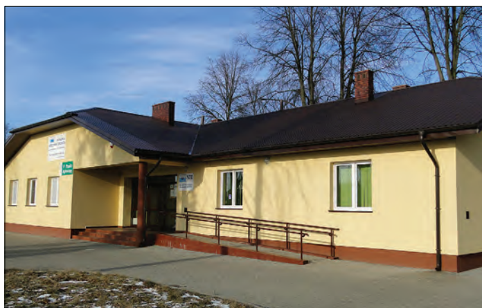
Gralewo – ośrodek zdrowia