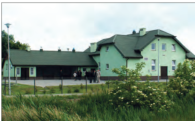
Oczyszczalnia ścieków w Gralewie