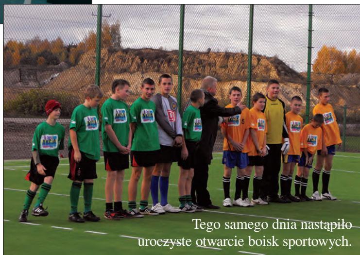
Tego samego dnia nastąpiło uroczyste otwarcie boisk sportowych.