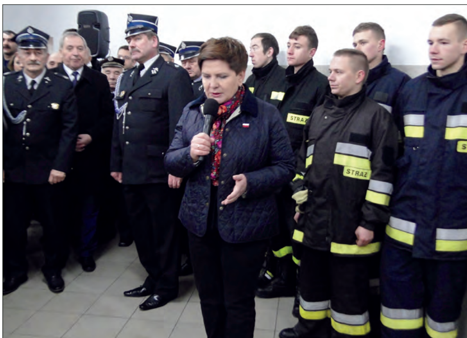
W strażnicy czekali na panią premier m.in. parlamentarzyści, samorządowcy, strażacy, duchowni oraz młodszy i starszy mieszkańcy Uniecka i okolic.

Potem Beata Szydło podeszła do druhów stojących przy wozie bojowym, tam kilka minut rozmawiała ze strażakami, po czym udała się do remizy. Zanim weszła do budynku, otrzymała jeszcze jeden bukiet, tym razem od reprezentanta lokalnej struktury PiS, notabene brata prezesa OSP.