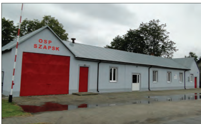
Remiza strażacka w Szapsku