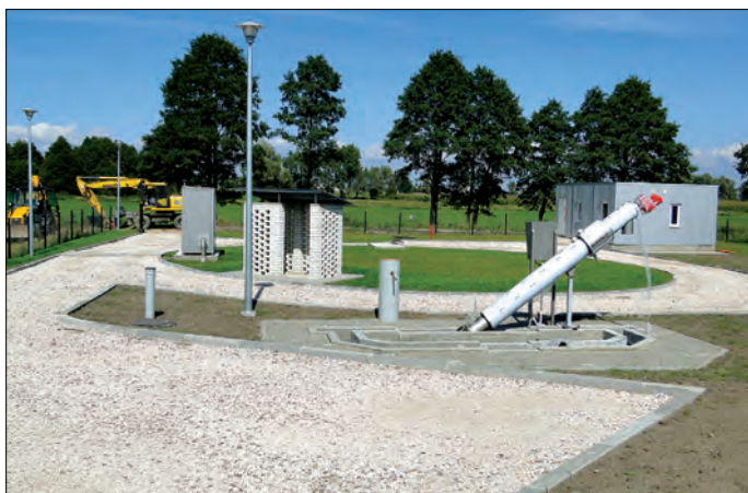
Oczyszczalnia ścieków w Uniecku