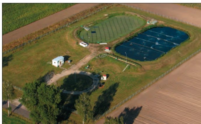
Oczyszczalnia ścieków w Koziebrodach