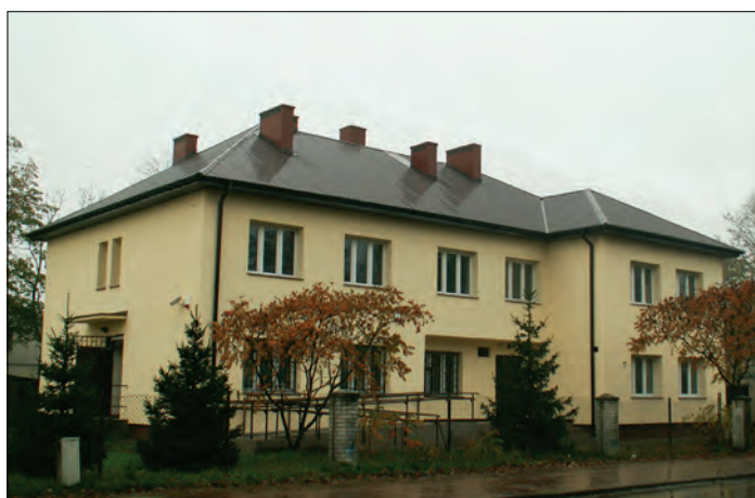
Koziebrody – ośrodek zdrowia