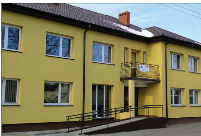
Unieck – ośrodek zdrowia