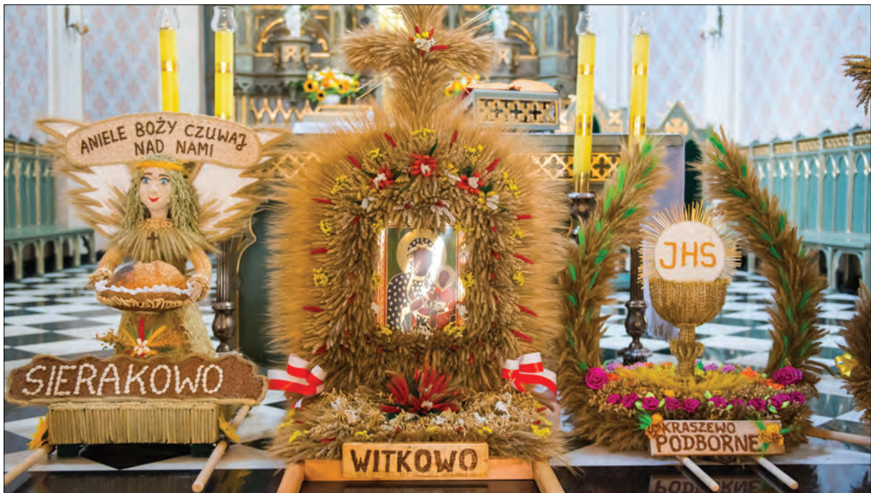
Fot. Biesiekierscy – Raciąż

W 2017 r. po raz pierwszy 15 sierpnia odbyły się w Raciążu parafialne dożynki miejsko-gminne, w organizację i przebieg których aktywnie włączyli się mieszkańcy gminy Raciąż z sołectw należących do parafii w Raciążu. Przed ołtarzem ustawiono wieńce