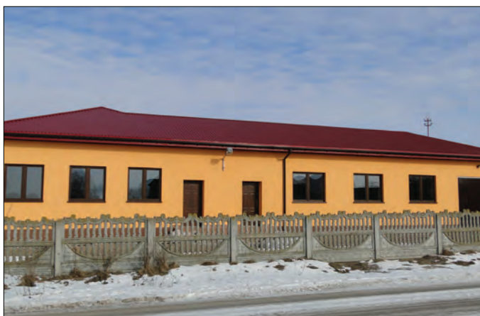
Jeżewo Wesel – remiza