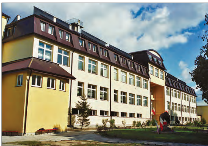
Szkoła w Gralewie