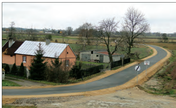
Droga w Witkowie