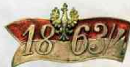
„MOJA MAŁA OJCZYŻNA” Artur Zybała Jeżewo – Wesel 2020