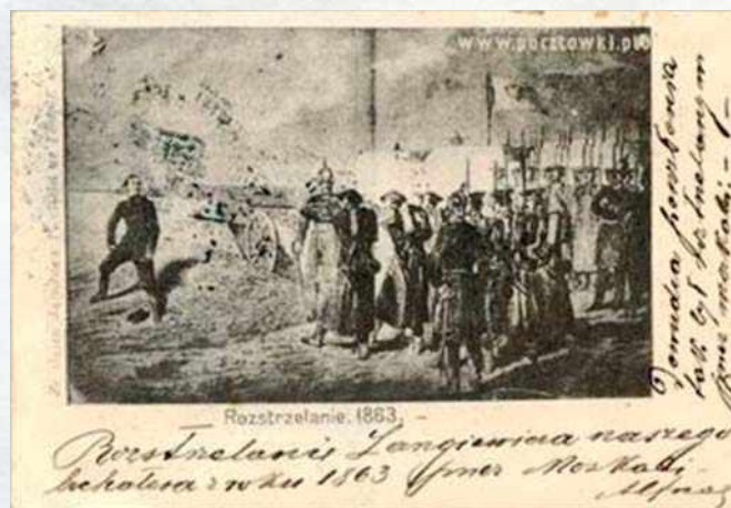
Awers i rewers karty pocztowej z wizerunkiem rozstrzelania gen. Zygmunta Padlewskiego w Płocku w dniu 15 maja 1863 r.