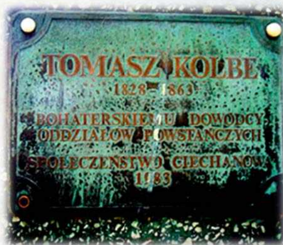
Tablica pamiątkowa usytuowana na pomniku ufundowana przez mieszkańców Ciechanowa w 1983 r.