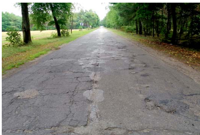
Fragment drogi powiatowej 3015W