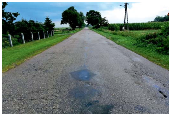
Fragment drogi powiatowej nr 3743W