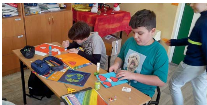
Uczniowie Szkoły Podstawowej w Starym Gralewie przygotowali laurki i upominki dla podopiecznych hospicjum w Kraszewie-Czubakach.