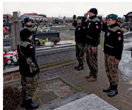
O Powstańcach pamiętali także przedstawiciele Jednostki Strzeleckiej 1863, którzy złożyli kwiaty i znicze pod pomnikiem na unieckim cmentarzu.