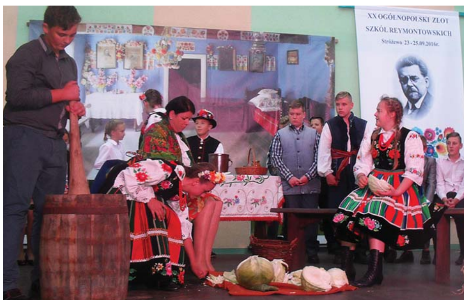
Gospodarze XX Ogólnopolskiego Zlotu Szkół Reymontowskich przygotowali inscenizację szatkowania kapusty u Borynów