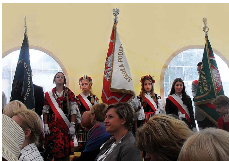
Delegacje przybyły na zlot ze szkolnymi sztandarami. Poczet sztandarowy z Koziebród – w środku