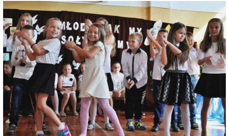
Występy i zabawy uczniów

16 września w Zespole Szkół im św. Stanisława Kostki w Starym Gralewie obchodzono dzień patrona szkoły. Uroczystość rozpoczęła się mszą św. ku czci patrona oraz w intencji całej społeczności szkolnej.