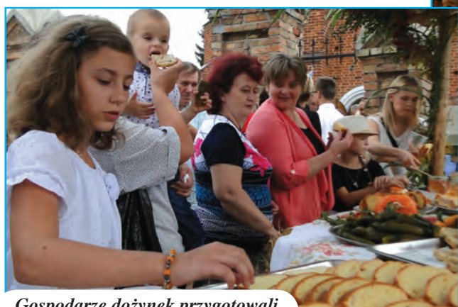
Gospodarze dożynek przygotowali dla wszystkich poczęstunek