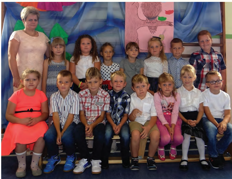
Uczniowie klasy I SP w Krajówko