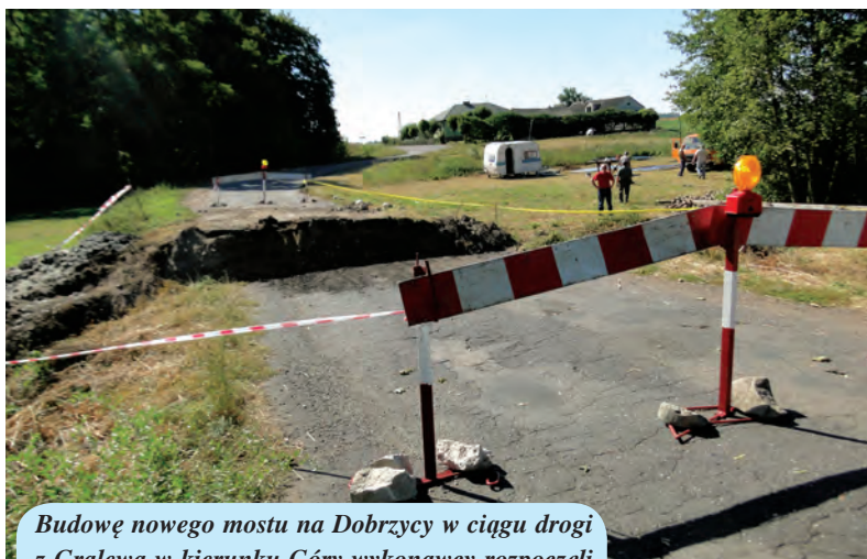
Budowę nowego mostu na Dobrzyca w ciągu drogi z Galewa w kierunku Góry wykonawcy rozpoczęli od rozbiórki starego