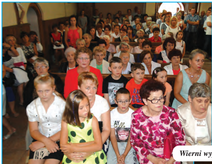
Wierni wypełnili świątynię