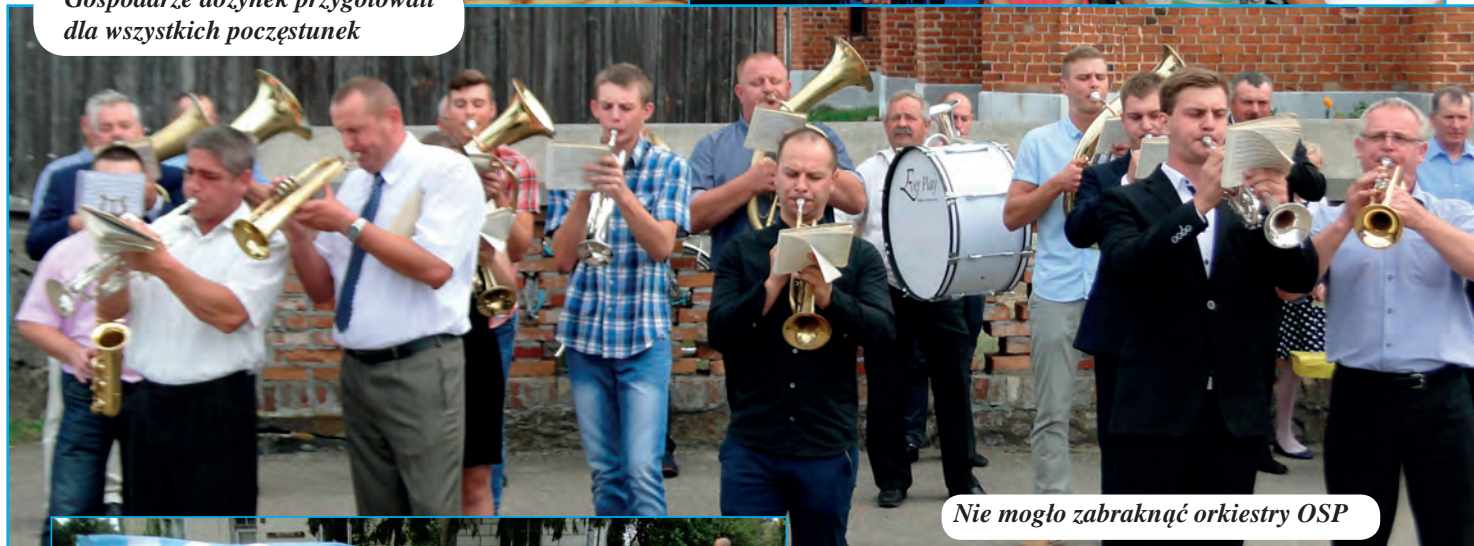
Nie mogło zabraknąć orkiestry OSP