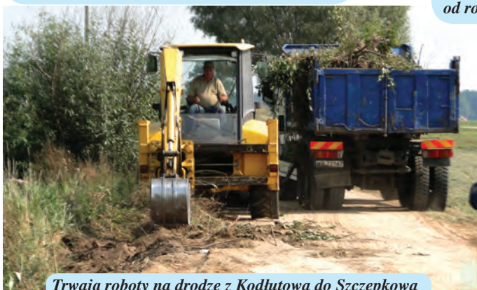
Trwają roboty na drodze z Kodłutowa do Szczepkowa