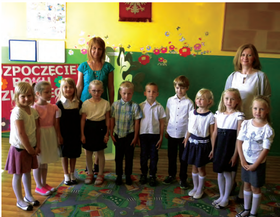
Uczniowie klasy I SP w Koziebrodach