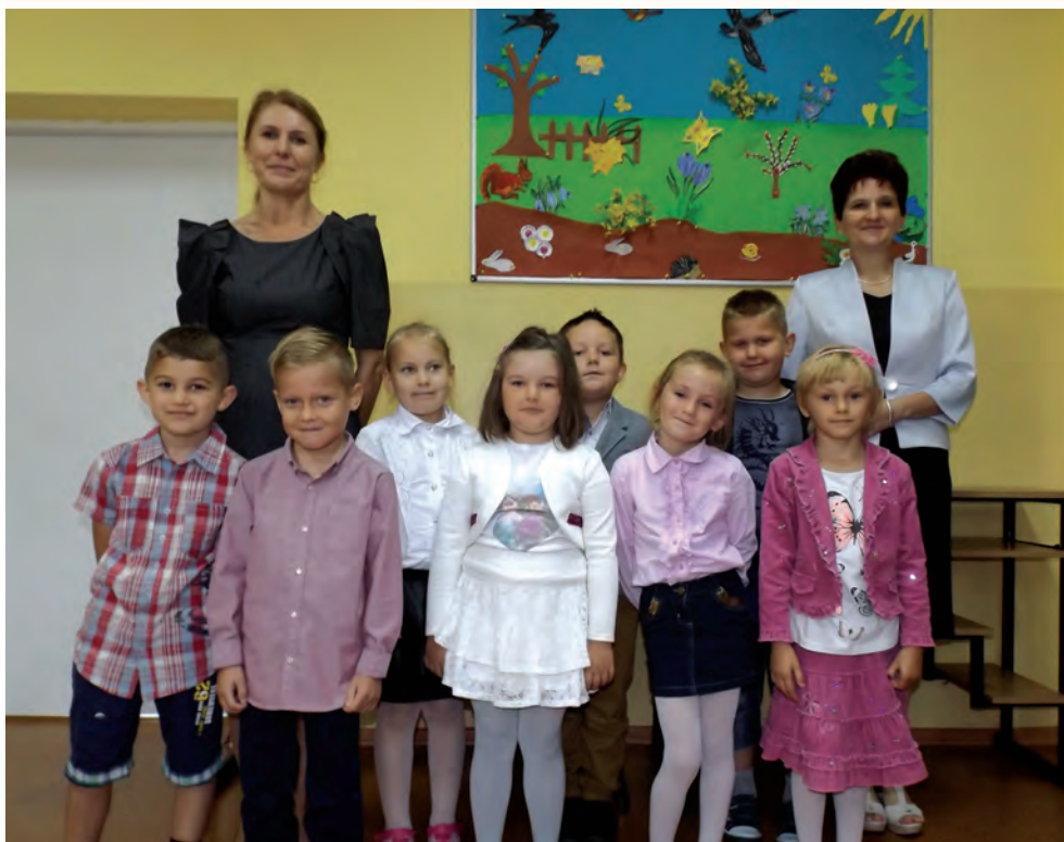
Uczniowie klasy I SP w Uniecku