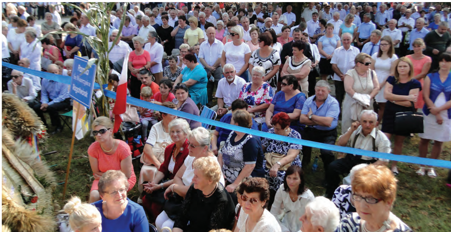
W nabożeństwie uczestniczyli wierni nie tylko z dekanatu racińskiego