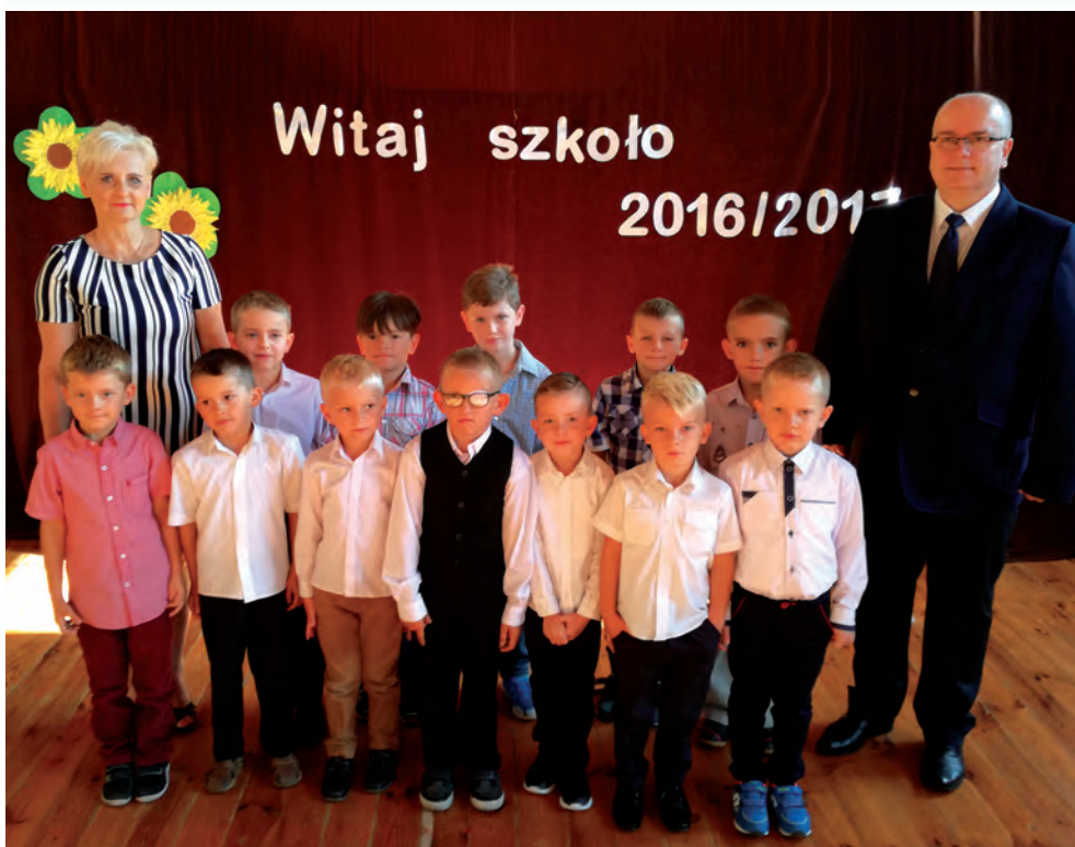
Uczniowie klasy I SP w Gralewo Starym