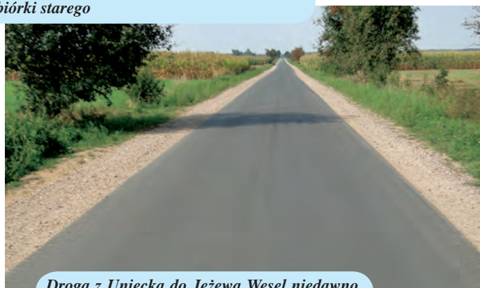
Droga z Uniecka do Jeżewa Wesel niedawno otrzymała nową nawierzchnię