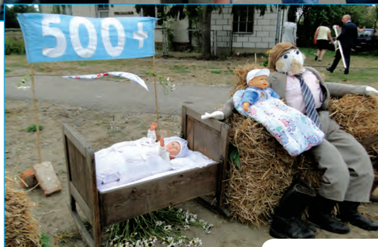
Była też wystawa bardzo aktualna