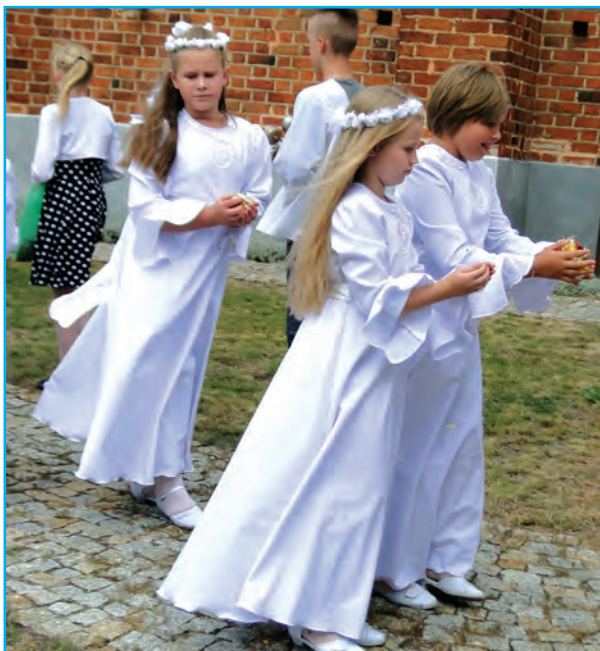
Procesja wokół kościoła