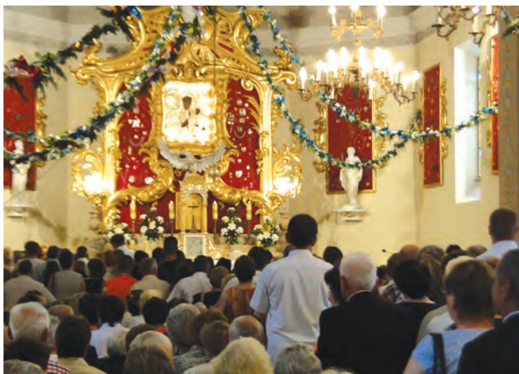
Pielgrzymi przed obrazem Matki Boskiej Koziebrodzkiej