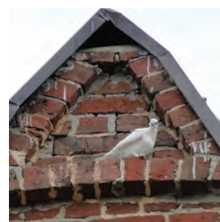
Na wszystko spoglądał z dachu kościoła biały gołąb