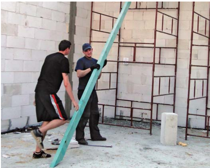
Druhowie nie zwlekają z robotą – trzeba kończyć więźbę dachową i kłaść blachę