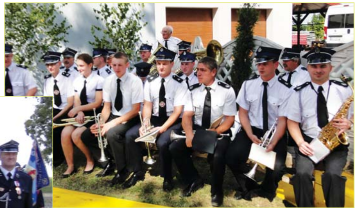
Uroczystość uświetniła orkiestra dęta OSP w Krajkowie