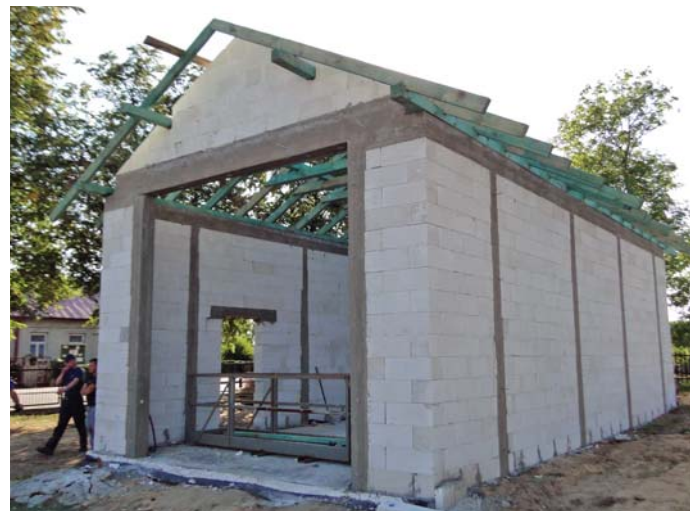
Garaż w budowie – stan z 25 sierpnia