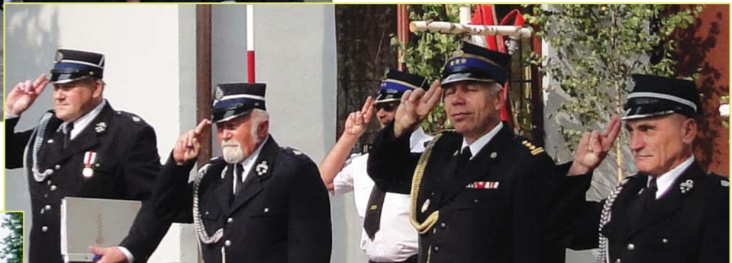
Komendant i prezesi odbierają defiladę strażaków