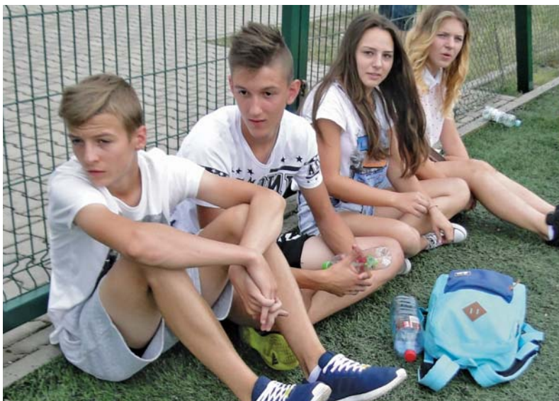
Młodzież kibicowała młodzieży, czyli zespołowi z Gralewa – najmłodszej drużynie uczestniczącej w zawodach