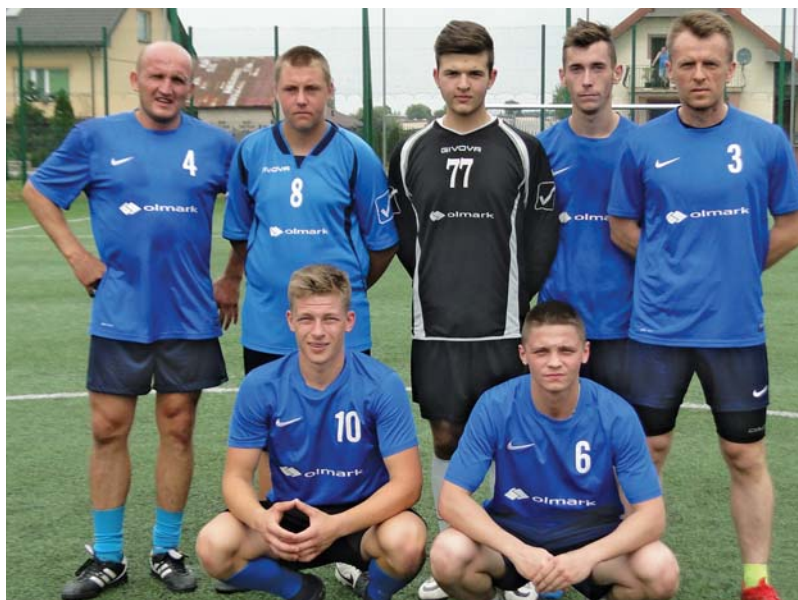
W turnieju zwyciężyła drużyna reprezentująca Koziebrody