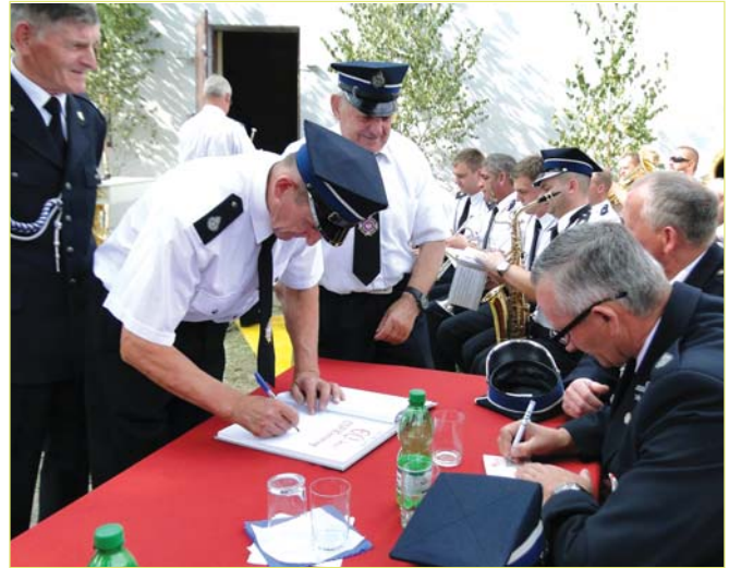
Goście wpisali się do książki pamiątkowej

Część oficjalną zakończyła defilada strażackich pododdziałów. Uroczystość uświetniła orkiestra dęta OSP w Krajkowie.