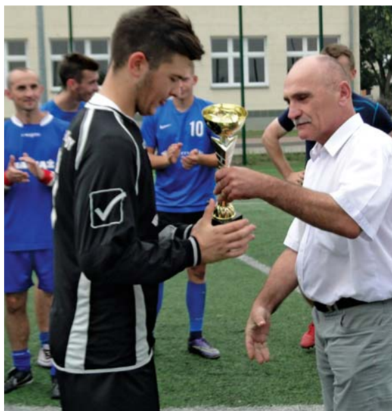
Puchar wójta odbiera kapitan zespołu z Koziebród