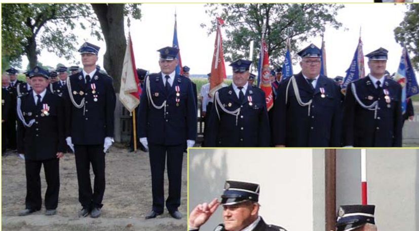
Strażacy odznaczeni Złotym Medalem „Za Zasługi dla Pożarnictwa”