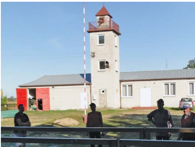
Widok remizy z wnętrza nowo budowanego garażu