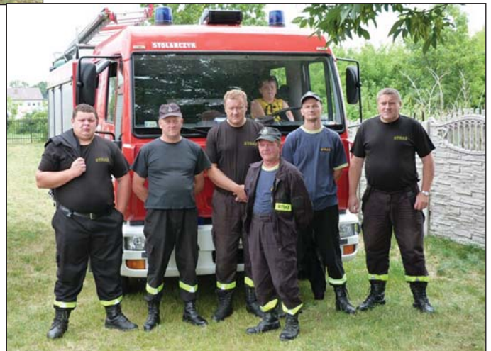
Drużyna OSP Kaczorowy