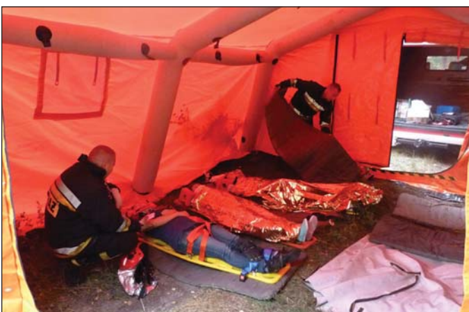
Strażacy ratowali rannych w pozorowanym wypadku drogowym