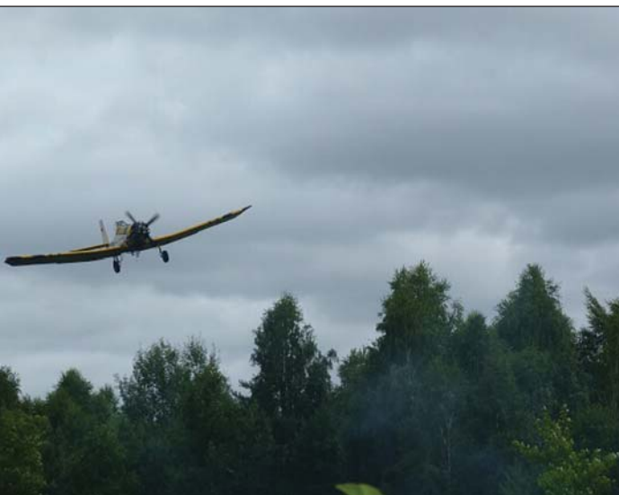
W akcji gaszenia wspierał ich samolot