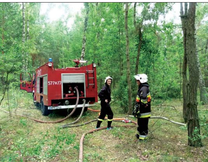
Wóz OSP Dobrska Kolonia „podaje” wodę do gaszenia lasu