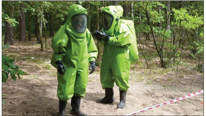
A to nie ufoludki, lecz druhowie w specjalnych kombinezonach, które...