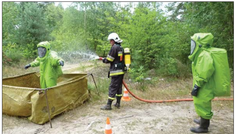
... po ćwiczenia trzeba było odkazić