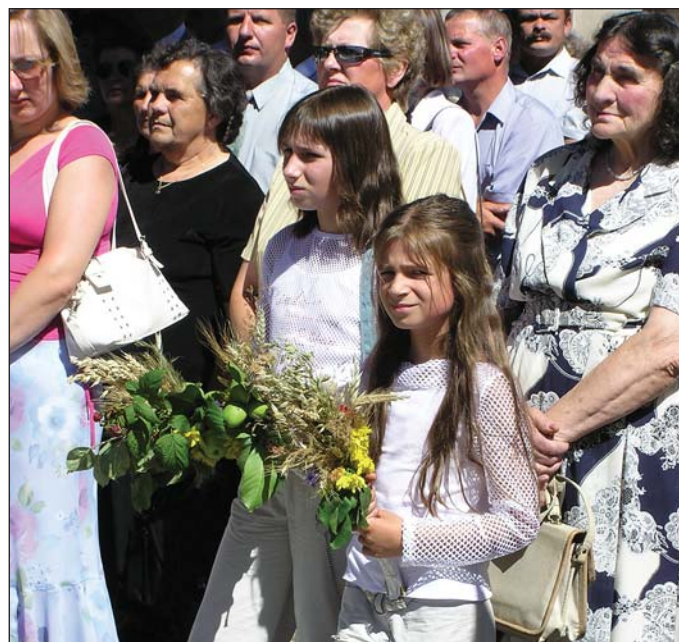
Wielu wiernych przynosi do poświęcenia wianki zielne, bukiety kwiatów, kłosa zbóż i owoce. Gdzieś święto Matki Boskiej Zielnej połączone jest z dożynkami.