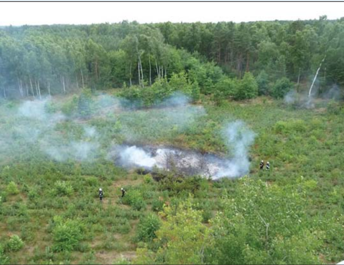
Druhowie musieli wykazać się skutecznością przy gaszeniu pożaru obszarów leśnych