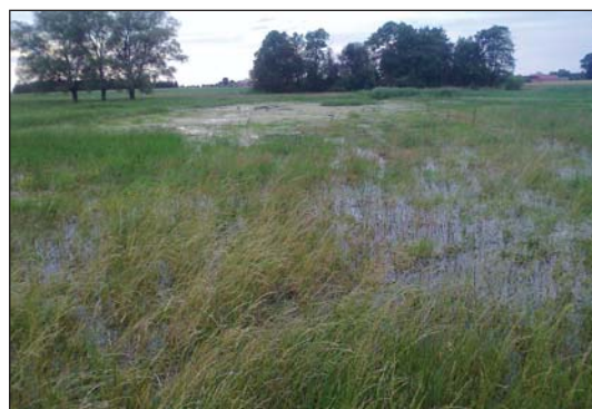
Zatkane przepusty, zarośnięte rowy, zalane łąki...