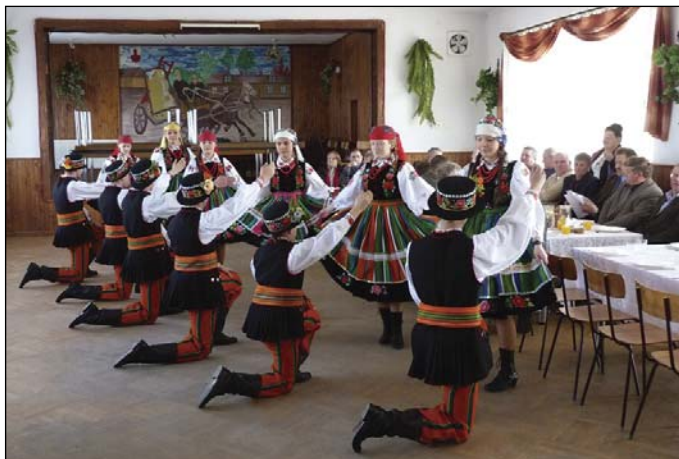
Delegatom zaprezentował się taneczny zespół ludowy ze szkoły w Krajkowie