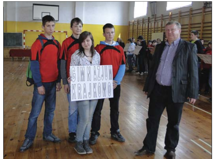
Drużyna Publicznego Gimnazjum w Krajkowie zajęła 6 miejsce