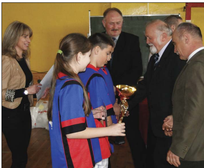
Gratulacje i nagrody odbiera reprezentacja gralewskiej podstawówki