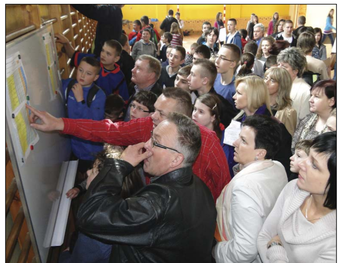
Po wywieszeniu wyników, każdy chciał jak najszybciej zobaczyć, które miejsce zajęła jego drużyna