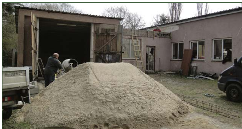
Remont remizy we wsi Dobrska Kolonia potrwa trzy miesiące

Trwa remont kolejnej remizy w gminie Raciąż. Tym razem modernizacji poddana została strażnica OSP w Dobrskach Kolonii.