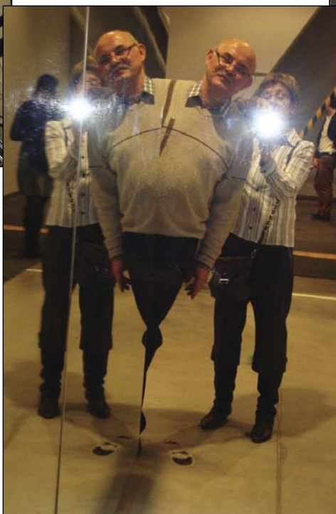
Opiekun grupy - tegi umysł, ma aż dwie głowy