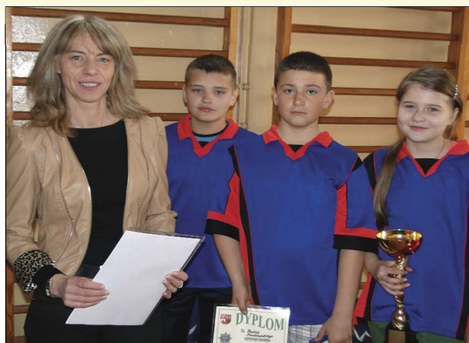
Mistrzowie powiatu płońskiego - reprezentacje Publicznego Gimnazjum (z lewej) i Szkoły Podstawowej w Starym Gralewie

Całkowitym sukcesem uczniów gralewskich szkół zakończył się Powiatowy Turniej Bezpieczeństwa w Ruchu Drogowym, który odbył się 20 kwietnia w Starym Gralewie. Gospodarze byli faworytami i nie zawiedli. Zwyciężyli zarówno drużynowo, jak i indywidualnie.