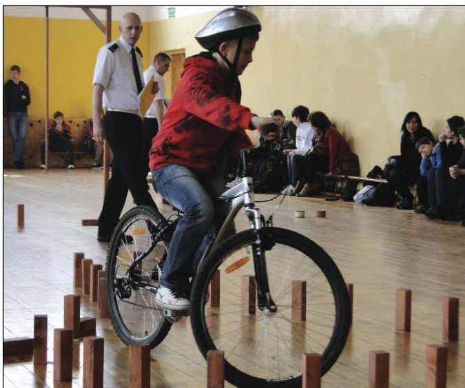
Najtrudniejszym elementem rowerowego toru przeszkód była tzw. łezka