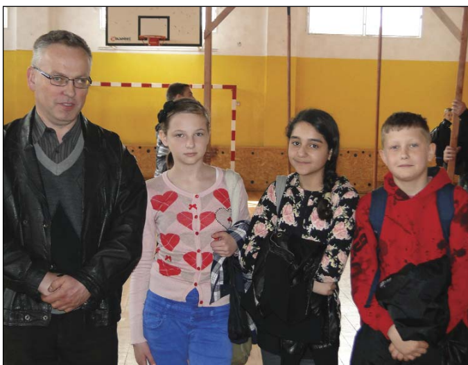
Zespół Szkoły Podstawowej w Uniecku zajął 5 miejsce