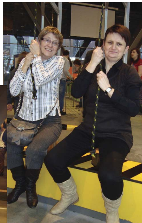
Opiekunki uczniów próbowały podnieść się wykorzystując maszyny proste, ale było trudno