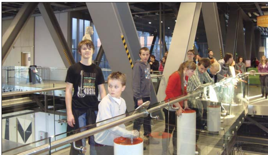
Uczniowie obserwują bombę wodorową