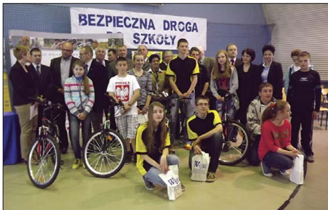
Na zdjęciu organizatorzy i laureaci

Konkursu „Bezpieczna droga do szkoły” organizuje od 2002 r. samorząd województwa mazowieckiego we współpracy z Wojewódzkimi Ośrodkami Ruchu Drogowego oraz komendantem stołecznymi komendantem wojewódzkim policji. Celem przedsięwzięcia jest poprawa bezpieczeństwa najmłodszych, dojeżdżających do szkół na rowerach oraz nauczanie właściwego reagowania w niebezpiecznych sytuacjach komunikacyjnych.