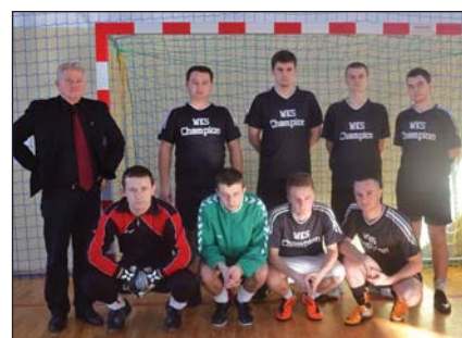
III MIEJSCE KOZOLIN