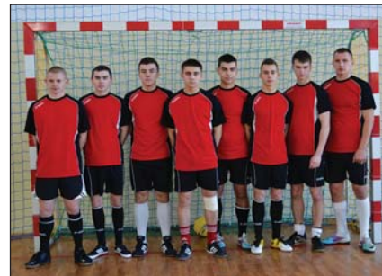
I MIEJSCE ZESPÓŁ SZKÓŁ W RACIAŻU