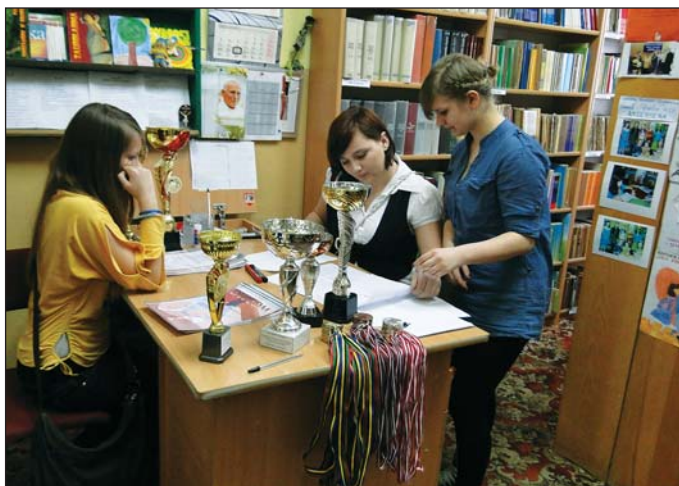
Na najlepszych czekały puchary, medale i dyplomy. Te ostatnie wypisywały krajkowskie gimnazjalistki