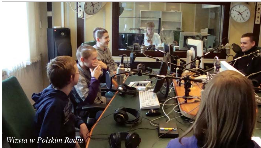
Wizyta w Polskim Radiu

Drugi projekt ma tytuł: „Pijesz ... płacisz – zdrowie tracisz”. Jego celem jest ochrona uczniów przed rozpoczę-