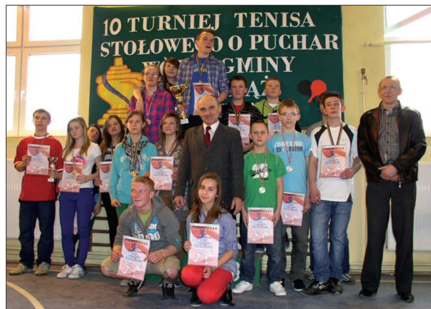
Najlepsi tenisiści z gimnazjów w towarzystwie wójty i dyrektora