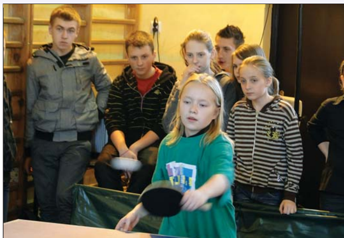
Na największy doping mogli liczyć gospodarze