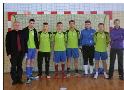
II MIEJSCE ZESPÓŁ SZKÓŁ STO W RACIAŻU