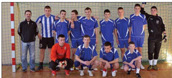
IV MIEJSCE GIMNAZJUM RACIAŻ