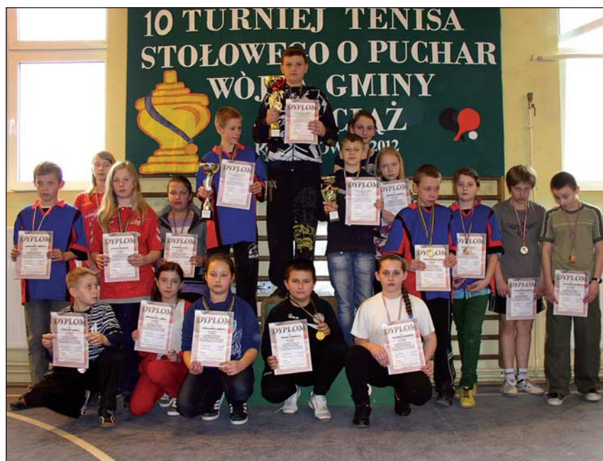
Najlepsi tenisiści ze szkół podstawowych