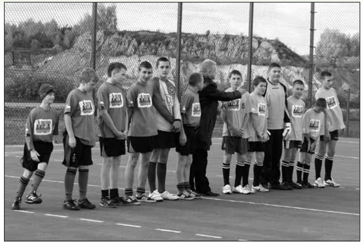
Otwarcie kompleksu sportowego w Krajkowie nie mogło się obyć bez pierwszych zawodów na nowym boisku