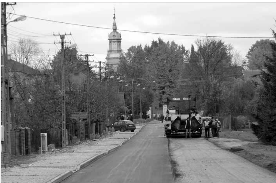
Przebudowę drogi powiatowej Druchowo–Koziebrody gmina Raciąż dofinansowała kwotą blisko 250 tys. zł