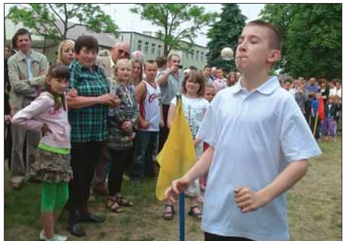
Dla dzieci przygotowane były konkursy