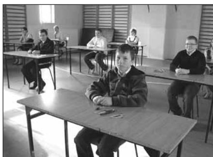
Szóstoklasiści z Krajkowa nie byli zestresowani przed testem

Najpierw szóstoklasiści (8 kwietnia), a kilka tygodni później gimnazjali-