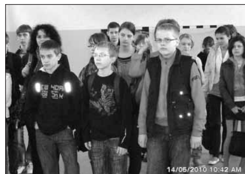
Do Uniecka przyjechało aż 47 uczestników z 6 szkół podstawowych i 4 gimnazjów