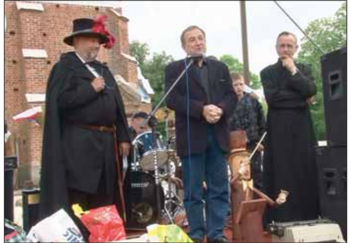
Gwiazdami festynu byli znani aktorzy – Maciej Rayzacher i Kazimierz Kaczor