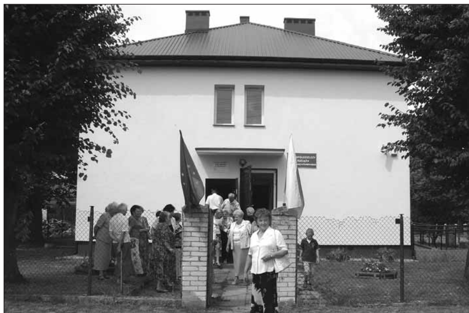
W Koziebrodach 14 lipca oficjalnie otwarte zostało centrum aktywizacji osób starszych

Dróg Lokalnych 2008–2010” wpłynęła dotacja na dofinansowanie zadania pn. „Przebudowa drogi gminnej w Druchowie” – 303.506,00 zł;