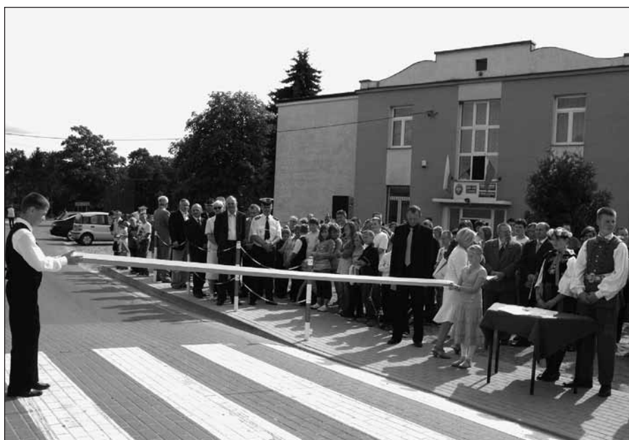
Do modernizacji drogi Krajkowo – Galomin gmina Raciąż dołożyła 220 tys. zł

Natomiast narastająco z uwzględnieniem lat poprzednich nadwyżka wynosi 2.183.991,20 zł.