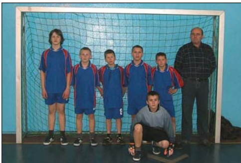
3 – SP UNIECK