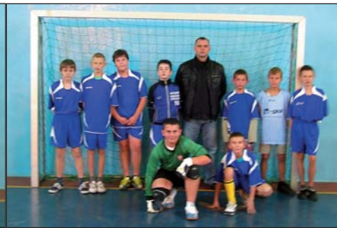
2 – SP RACIĄŻ