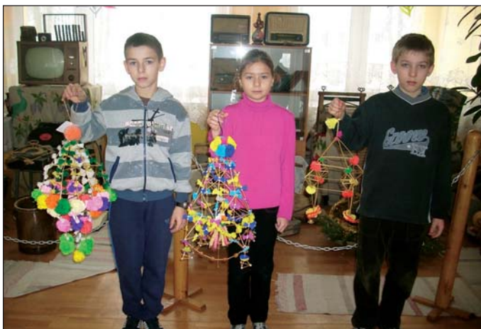
Uczniowie prezentują bożonarodzeniowe pajęki

Celem konkursu jest upowszechnianie tradycji związanych ze świętami Bożego Narodzenia oraz rozwijanie zainteresowań kulturą ludową wśród uczniów.