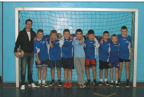
4 – SP KOZIEBRODY