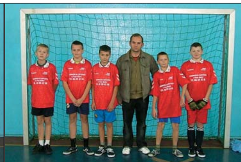
6 – SP KODŁUTOWO