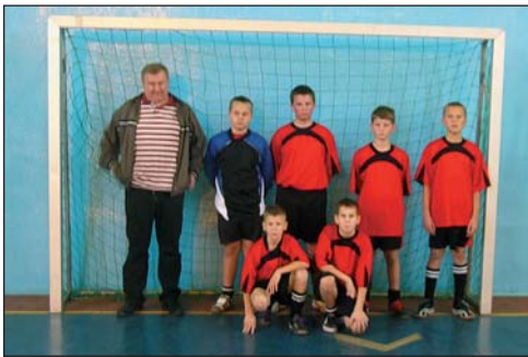
1 – SP KRAJKOWO