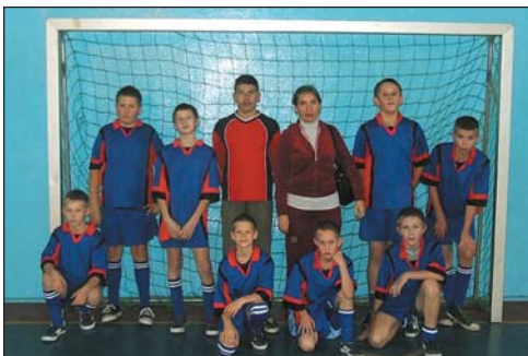
5 – SP GRALEWO