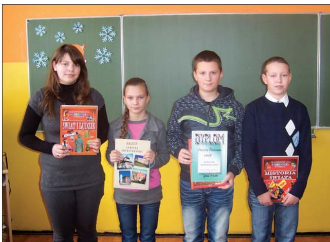
Laureaci tegorocznego konkursu Mistrz Ortografii

Szkoła Podstawowa w Starym Gralewie po raz kolejny zorganizowała konkurs dla uczniów szkół podstawowych z terenu gminy Raciąż o tytuł „Mistrza Ortografii”.