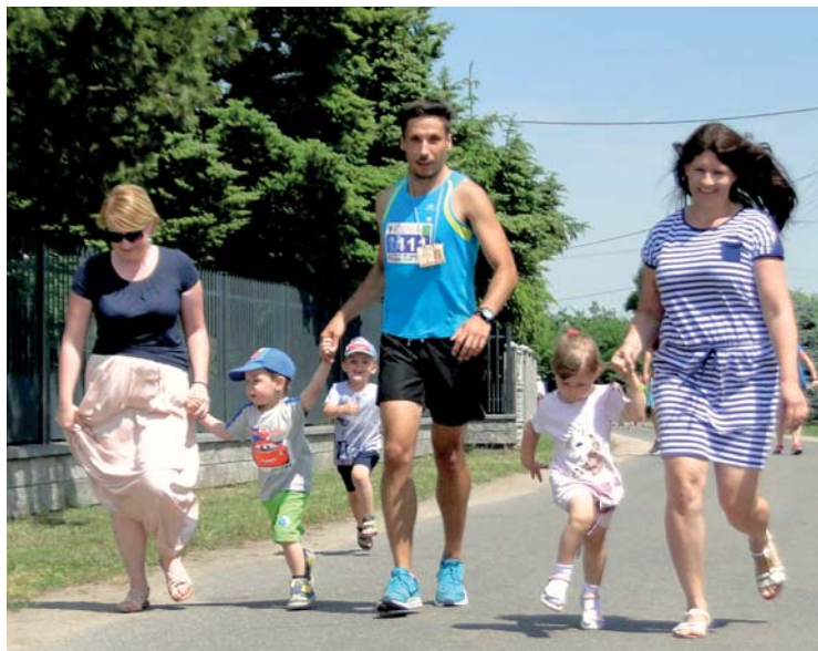
Z mamą albo tatą łatwiej jest pokonać trudności