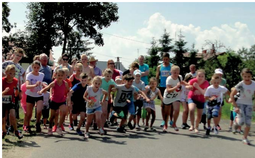
Najwięcej emocji wzbudził bieg najmłodszych