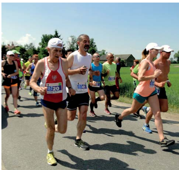
Przed nimi 10 km