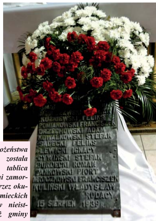
Podczas nabożeństwa poświęcona została pamiątkowa tablica z nazwiskami zamordowanych przez okupantów niemieckich mieszkańców nieistniejącej już gminy Strożęcín