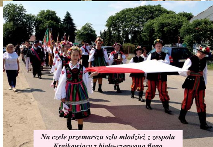
Na czele przemarszu szła młodzież z zespołu Krajkowiaczy z biało-czerwoną flagą