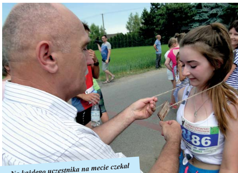
Na każdego uczestnika na mecie czekał pamiątkowy medal i gratulacje