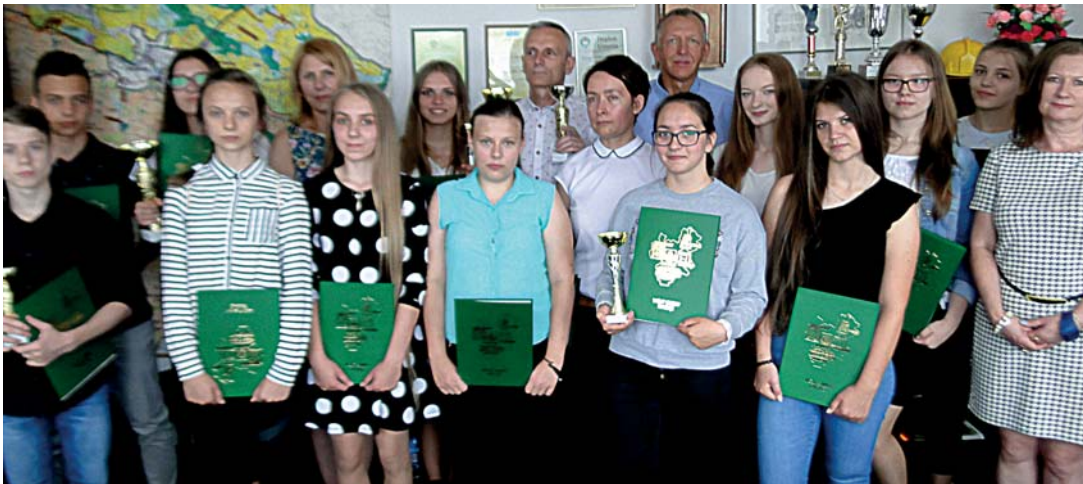
Laureaci konkursu „Wiem wszystko o gminie Raciąż” z dyrektorami i opiekunami

Uroczyste podsumowanie konkursu odbyło się podczas sesji czerwcowej Rady Gminy Raciąż. Nagrody najlepszym ufundowała gmina Raciąż.