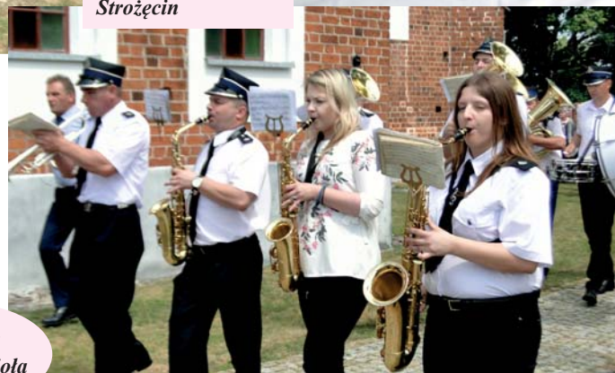
Procesja wokół kościoła