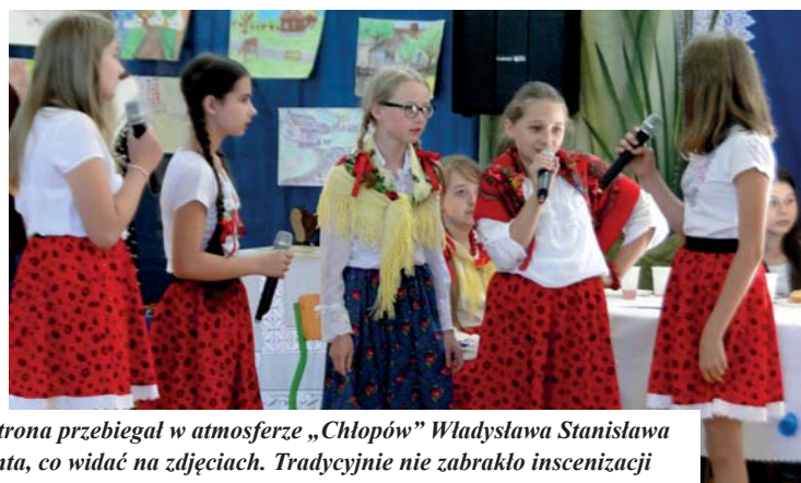
Dzień Patrona przebiegał w atmosferze „Chłopów” Władysława Stanisława Reymonta, co widać na zdjęciach. Tradycyjnie nie zabrakło inscenizacji fragmentów tej najważniejszej w twórczości patrona szkoły powieści