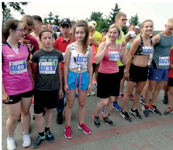
Liczną grupę wśród uczestników biegu na 3 km stanowili mieszkańcy gminy Raciąż