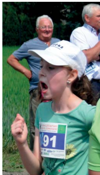
Meta tuż, tuż