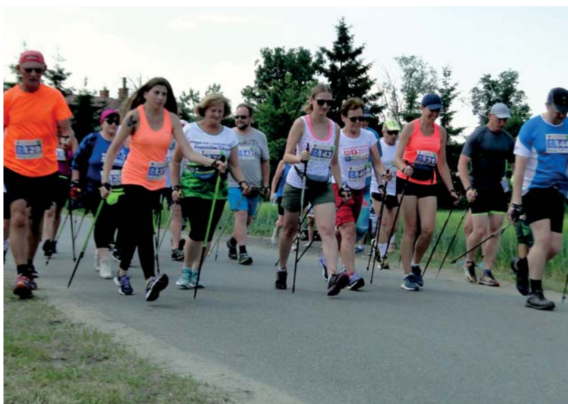
W tym roku na starcie w Kraszewie Gaczułtach zameldowali się fani marszu z kijkami