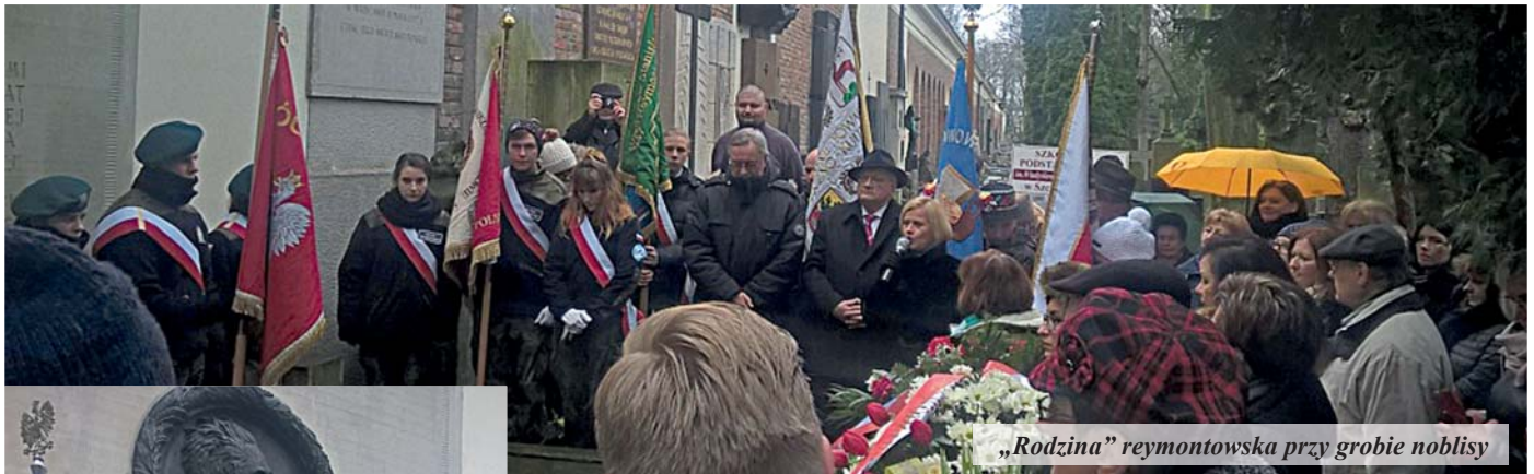
„Rodzina” reymontowska przy grobie noblisty