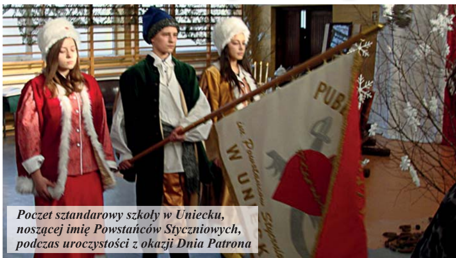
Poczet sztandarowy szkoły w Uniecku, noszącej imię Powstańców Styczniowych, podczas uroczystości z okazji Dnia Patrona