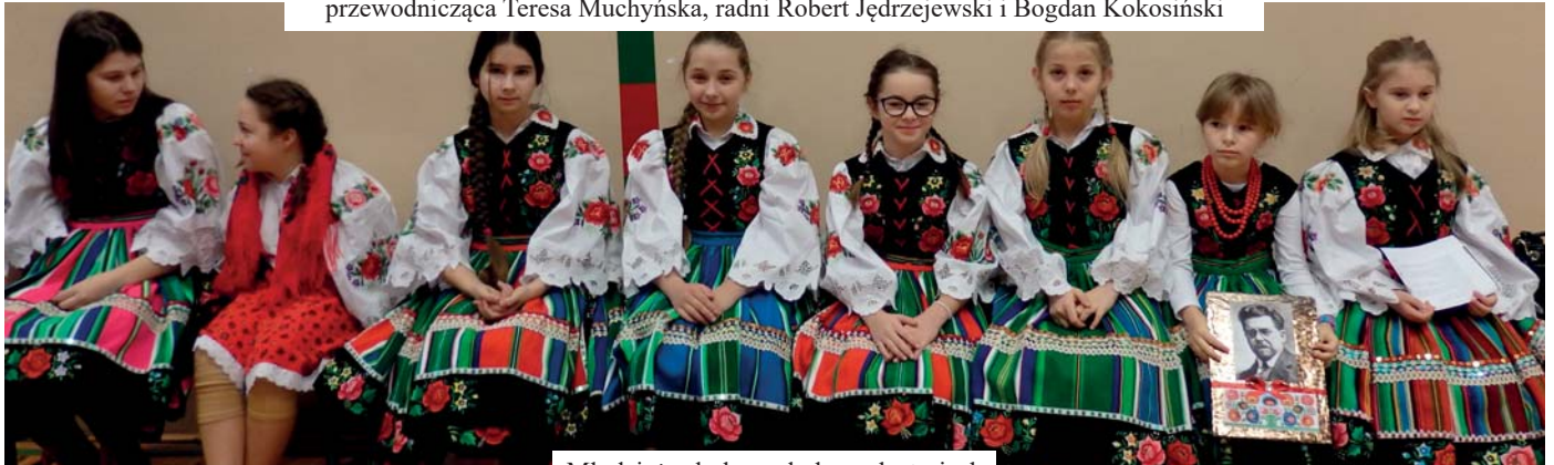
Młodzież szkolna w ludowych strojach