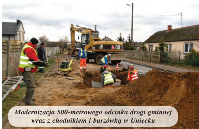
Modernizacja 500-metrowego odcinka drogi gminnej wraz z chodnikiem i burzówką w Uniecku