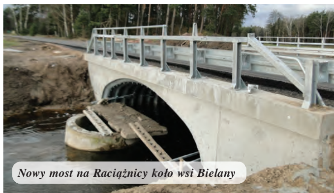
Nowy most na Raciążnicy koło wsi Bielany