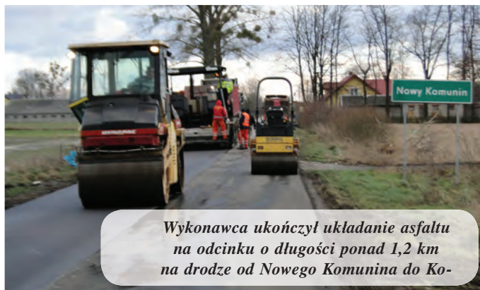
Wykonawca ukończył układanie asfaltu na odcinku o długości ponad 1,2 km na drodze od Nowego Komunina do Ko-