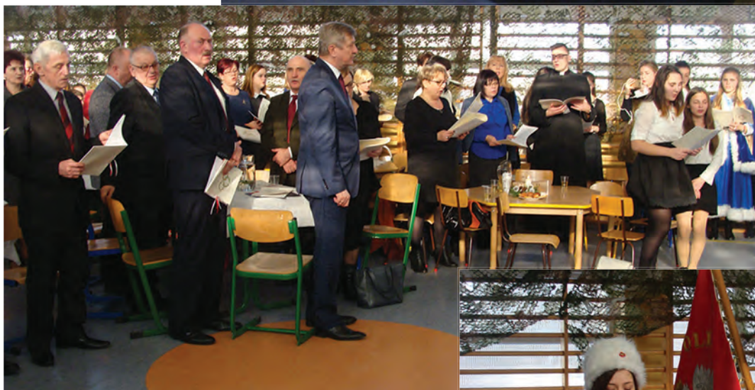
Pieśń „Boże coś Polskę” śpiewała cała sala