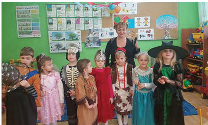
Bal karnawałowy i Dzień Babci i Dziadka w Punkcie Przedszkolnym w Raciążu