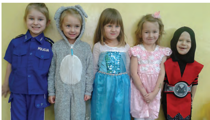
10 lutego wraz z oddziałami przedszkolnymi dzieci uczestniczyły w balu przebierańców.