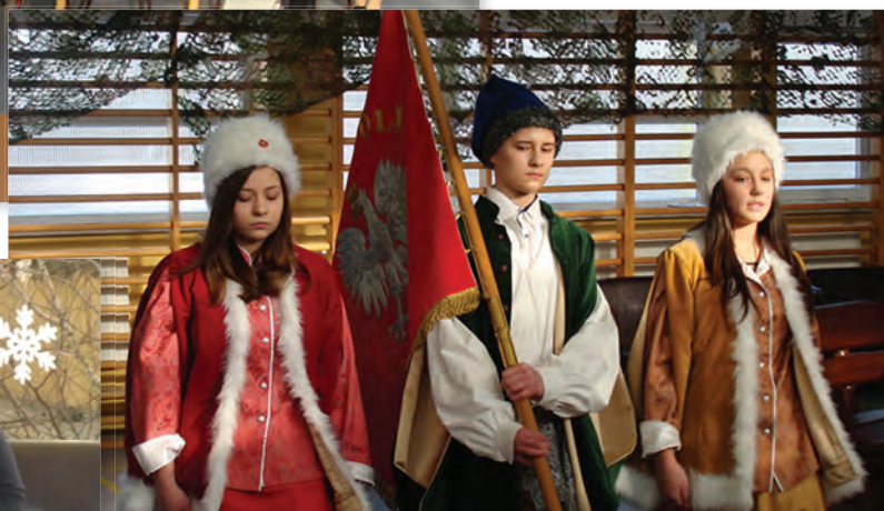
Poczet sztandarowy szkoły