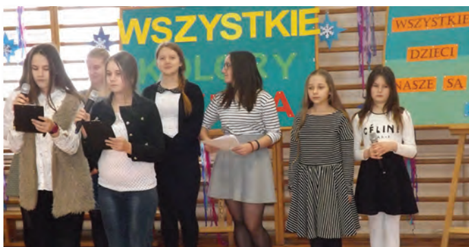
Wykonawcy części artystycznej