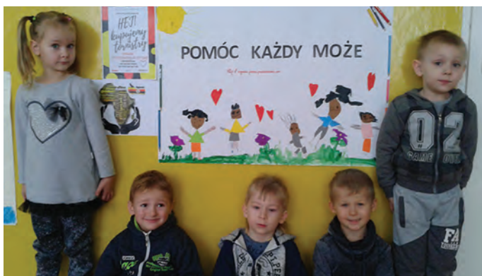
Nauczyciele przedszkola włączają się w kampanię pomocową dla dzieci Ugandy. Akcja stała się inspiracją do zajęć z przedszkolakami.