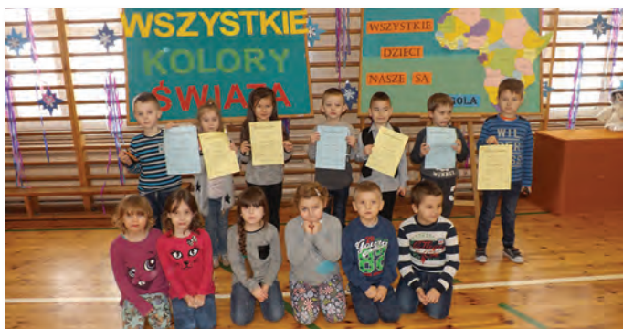
Dzieci otrzymały podziękowania za udział w akcji