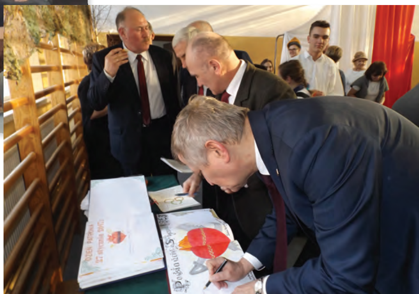
Goście wpisali się do ksiąg pamiątkowych